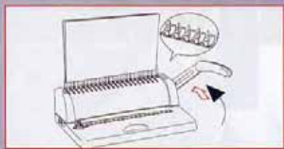
打開膠圈，並把打好孔的紙張和裝訂封面套入打開的齒上，然後合上膠圈